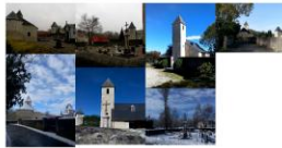
Météo : Église de la fin du Moyen-Âge, église saint Jean-Baptiste, patrimoine du Béarn.